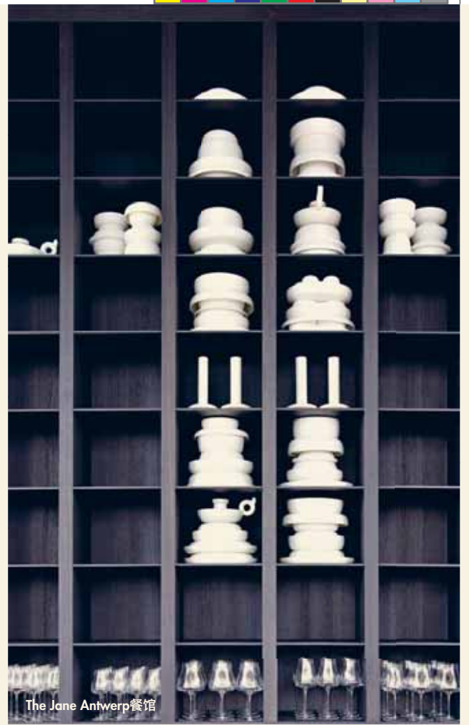
The Jane Antwerp 餐馆