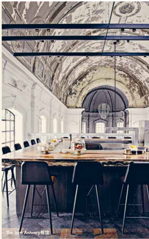
The Jane Antwerp 餐馆