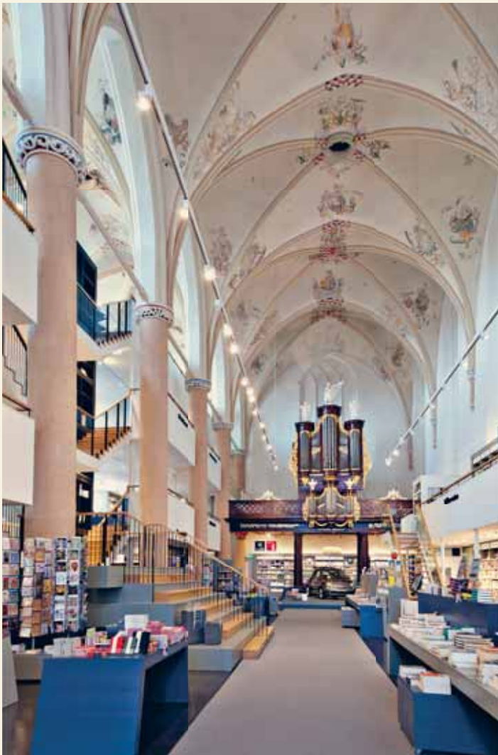
Waanders In de Broeren 特色书店