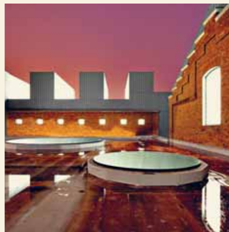
上图 Centro Cívico Cultural de Palencia原是囚禁犯人的监狱，如今变成鼓励文化交流的开放空间。 下图 Fondaco dei Tedeschi变身购物商场，新添电动扶梯和钢铁玻璃天花板等现代的便利与设计元素。