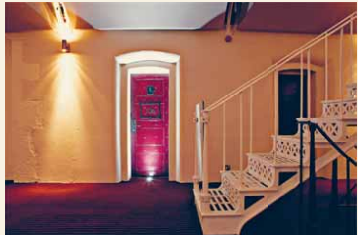
Malmaison Oxford 酒店